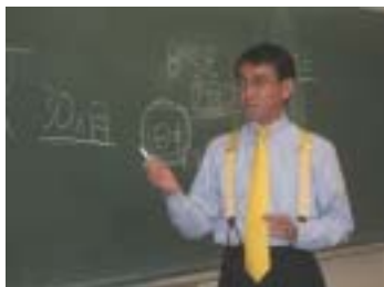
講義中の河野太郎氏

2008年度はコミュニケーション文化専攻の企画で、共通テーマは「イメージの作られ方 - ホンモノとニセモノの狭間で - 」。イメージはどのようにつくられてしまうのか、真理を見抜く感性を培うにはどうしたらよいか、歴史像、人物像、社会像、国家像・・・などに焦点をあてながら、その多面的な姿を探りました。