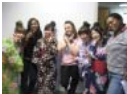
ボランティアの仲間たち