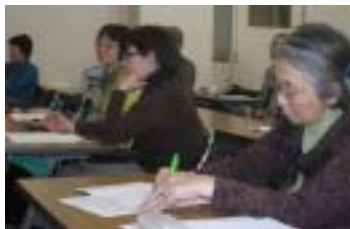
熱心な受講生たち

また、この市民講座は本学学生の自由参加も歓迎しており、毎年、熱心な学生が出席しています。