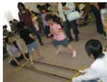
フィリピンのバンブーダンス

新しい自分とは違う国の遊びを知ること、その国に親しみをもち興味がわきました。外国人の方から、民族衣装を着てみたら、と勧めてもらったり、遊び方を教えていただきながら、ささやかな国際交流を楽しみました。このようなことから、交流の場を大切にしていることがうかがえました。小さい頃から違う文化に触れられるということは、日本の子どもにとっても大きな影響を与えられると思います。