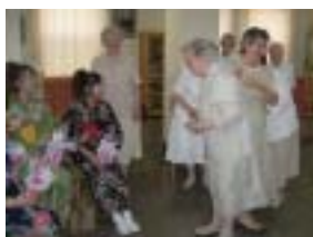
修道院でシスター方と歓談